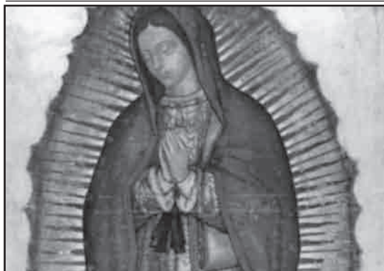
NUESTRA SEÑORA DE GUADALUPE