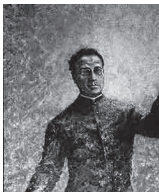
Beato Gonzalo Viñes