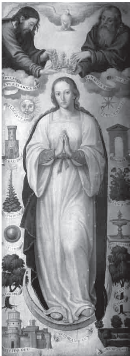
Inmaculada. Juan de Juanes. Bocàrent.

Tú eres la gloria de Jerusalén. Tú eres el orgullo de nuestra raza. Tú eres la alegría de nuestro pueblo.