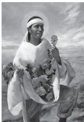
San Juan Diego

Santa Lucía, virgen y mártir. Siracusa, Año 304.